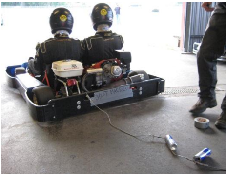
Ein bisschen Spaß muss sein

Am darauffolgenden Tag wurden der Autocross sowie der Endurance auf dem Gelleråsen Circuit, einer Kartstrecke, ausgetragen. Nach dem Coursewalk fuhren gleich die ersten Autos auf die Strecke, so auch der epsilon2010 . Schnell zeigte sich, dass Kurs, Setup und die Fahrer optimal zusammenpassten. Bereits nach dem ersten Durchgang lag das TU Darmstadt Racing Team mit einer Zeit von 38,54 Sekunden fast 3 Sekunden vor dem zweitplatzierten Team. Im Folgenden konnte die Zeit gar auf 38,2 Sekunden verbessert werden. Am Ende stand auch hier unser Team auf dem ersten Platz, gefolgt von Tallin und Eindhoven.