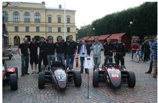
Verbrenner und Elektro in Karlstad

So musste der epsilon2010 gegen die aktuellen Fahrzeuge von Helsinki (4. Platz Formula Student Germany), Chalmers (4. Platz Formula Student Silverstone), Tallinn (11. Platz FSG) und das aktuelle Elektroauto aus Eindhoven (6. Platz FSG Electric) antreten.