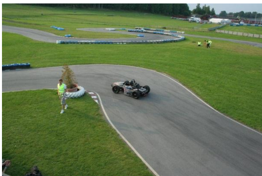
Auf der Strecke

Der erste Wettbewerbstag startete mit dem Skidpad Event. Nach einer verregneten Nacht trocknete die zunächst feuchte Strecke langsam ab. Das Team um den epsilon2010 entschied sich daher für einen späten ersten Lauf in dieser Disziplin, um die besser werdenden Streckenbedingungen für sich nutzen zu können. Das Reglement sah, anders als bei offiziellen Wettbewerben, keine Begrenzung auf vier Läufe vor, sodass mehrere Fahrer ihr Können unter Beweis stellen durften. Nach einem zwischenzeitlichen 2. Platz hinter den Gastgebern stand das Team letztendlich mit einer Zeit von 23,15 Sekunden ganz oben auf der Anzeigetafel