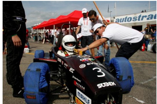
Bei der technischen Abnahme

Da wir im ersten Block der Registration waren, waren wir auch eines der ersten Teams, die zur technischen Abnahme konnten. Bis auf Probleme mit der Bewegungsfreiheit des Ansaugrohrs der Airbox und einigen Kleinigkeiten gab es keine großen Hindernisse um den ersten Sticker zu bekommen. Anschließend wurde mit dem Tilt Table, dem Noise-Test