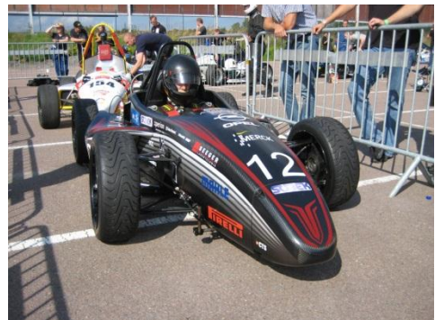
Anstehen für den nächsten Run

Motiviert durch die Geschehnisse vom Vormittag und die anhaltend guten Wetterbedingungen, die schnelle Zeiten versprachen, entschied sich das Team für einen frühen Start im Acceleration. Im Laufe des Nachmittags entwickelte sich ein spannender Zweikampf zwischen dem Chalmers Team aus Göteborg und dem Team um den epsilon2010 . Auch in dieser Disziplin wurde die Anzahl der Versuche durch die Organisatoren nicht beschränkt, sodass die Fahrer beider Teams in etlichen Läufen um jede Hundertstel Sekunde kämpften.