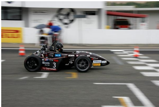
Zieleinlauf beim Acceleration

Der Montag sollte der letzte Event-Tag der Saison 2011 sein. Durch die mäßige Platzierung im Autocross (Platz 22/50) starteten wir relativ früh ins Rennen. Der Kurs war wieder extrem langsam und hatte mit drei Haarnadelkurven hintereinander eine sehr anspruchsvolle Passage. Bevor wir starten konnten, waren bereits 2 Teams disqualifiziert. Die jeweiligen Autos hatten zu viele Probleme mit der ersten Haarnadelkurve. Um kurz vor 12 Uhr war es dann so weit.