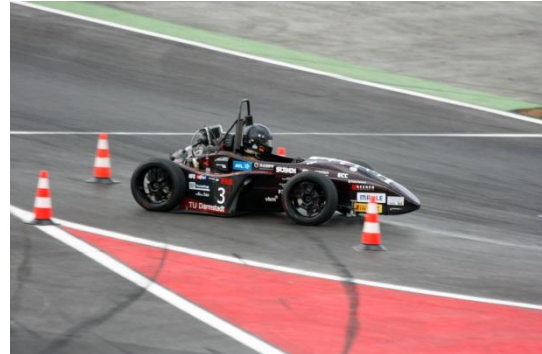
Auf der Endurance-Strecke

Bei inzwischen wieder schönerem Wetter startete unser erster Fahrer in den Kurs. Obwohl enge Strecken unserem Auto normalerweise nicht gut liegen, sah man auf der ersten Runde schon, dass im Endurance eine gute Platzierung im Bereich des Möglichen war. Auch die besagte Haarnadelkurve stellte kein Problem dar.