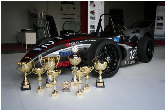
Die gehalten Pokale

Wie gewohnt wurde der Endurance in umgekehrter Reihenfolge zu den Ergebnissen des Autocross gestartet. Das Gesamtpaket epsilon2010 bestehend aus Fahrzeug, Setup, Fahrer und dem dahinterstehenden Team bewies auch im Endurance seine Qualitäten mit konstant schnellen Rundenzeiten. Allein der Fahrerwechsel bot kurzzeitig Spannung, da der Tausch einer Gaskartusche in Rekordzeit durchgeführt werden musste. Daraufhin fuhr das Team einem ungefährdeten Sieg im Endurance entgegen. Am Ende resultierte aus den spannenden Wettkampftagen in Schweden der Gesamtsieg der Baltic Open 2011. Dabei ließ das Team um den epsilon2010 keinen Punkt auf der Strecke und erreichte die maximal mögliche Punktzahl – eine bemerkenswerte Leistung!